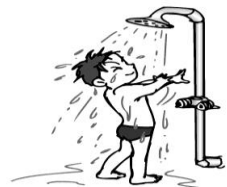
前日はお風呂に入り、プールに入る前、出た後は体をシャワーでよく洗う