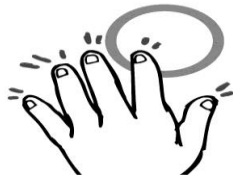
手足の爪は短く切っておく