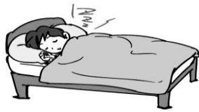
睡眠を十分にとる

楽しみに、次のようなことに気を付けて 楽しく、安全にプールに入るための準備運動をきちんとする