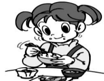
朝食や昼食をしっかりと食べる