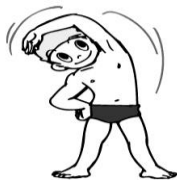
準備運動をきちんとする