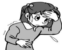
ケガをしているとき、体調がわるいときには入らない